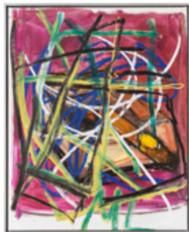
MARTIN LUKÁČ Still life with a cigar, 2023 oil and oil stick on canvas | 85 x 106.5 cm