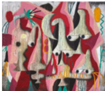
JÓZSEF CSATÓ Burgundy Vibes, 2022 oil, acrylic on canvas | 140x160 cm SOLD